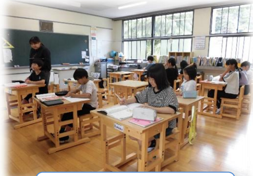
5・6年生の授業の様子

これからの5・6年学級が、とても楽しみです。そして、5・6年生を手本として、3・4年生、1・2年生も、複式授業の中でしっかり力をつけていってほしいと思います。