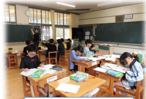
3・4年生の授業の様子